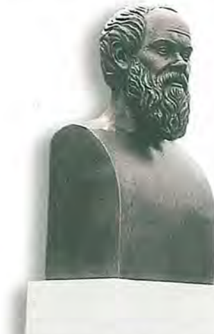
Σωκράτης. Ο αρχηγός της κλασικής Ελληνικής Φιλοσοφίας και διδάσκαλος του «Γνώθι σ' αυτόν». Η προτομή του φιλοτεχνήθηκε από τον γλύπτη Θεόδωρο Παπαγιάννη, Καθηγητή της Ανωτάτης Σχολής Καλών Τεχνών Αθηνών.