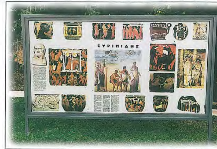
Μια όψη από τη θεματική του Αρχαίου Δράματος . Στο μέσο διακρίνεται η Θυσία της Ιφιγένειας , έργο του μεγάλου αρχαίου ζωγράφου Τιμόθεου . Αριστερά, δραματική σκηνή από τη Μήδεια και στην άκρη δεξιά η Ιφιγένεια εν Ταύροις . Η θεματική του Αρχαίου Δράματος αναπτύσσεται πίσω από το υπάρχον θέατρο 200 περίπου θέσεων. Μπροστά από το θέατρο είναι οι προτομές των τριών μεγάλων τραγικών ποιητών, Αισχύλου , Σοφοκλή , Ευριπίδη και των δύο μεγάλων κωμικών ποιητών Αριστοφάνη και Μενάνδρου .

Τα τελευταία χρόνια έχουν επισκεφτεί το Κέντρο ξεχωριστές προσωπικότητες όπως η Α.Θ.Π. ο Οικουμενικός Πατριάρχης κ. κ. Βαρθολομαίος, ο Μακαριώτατος Αρχιεπίσκοπος Αθηνών και Πάσης Ελλάδος κ. κ. Χριστόδουλος, ο Σεβασμιώτατος Μητροπολίτης Κορίνθου κ. κ. Διονύσιος πρεσβύτες ξένων χωρών, ο Υπουργός Εξωτερικών της Κύπρου κ. Γιώργος Ιακώβου, Έλληνας και Κύπριοι Βουλευτές, ο Νομάρχης Κορινθίας, Δήμαρχοι των δήμων της περιοχής, ο Δήμαρχος Λευκωσίας, ο σκηνοθέτης κ. Μιχάλης Κακογιάννης κ.ά.