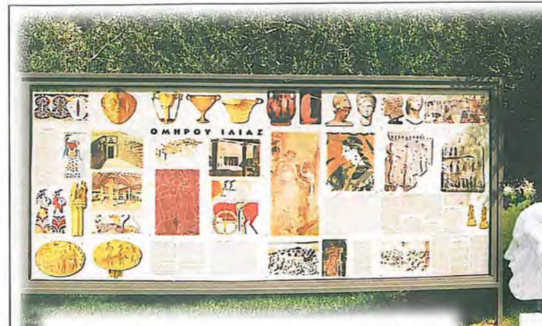
«Ομήρου Ιλιάς». Η μια όψη της ομώνυμης θεματικής ενότητας. Διακρίνονται αριστερά ευρήματα από τις πολύχρυσες Μυκήνες και αναπαράσταση του ανακτόρου της Πύλου του Νέστορος . Στο μέσο δεξιά, σε δύο παραστάσεις, η Ωραία Ελένη . Σε κάθε όψη περιλαμβάνεται εισαγωγή και περίληψη των εικονιζόμενων ραψωδιών. Κάτω δεξιά, ο αρχηγέτης της Ελληνικής παιδείας Όμηρος , μαρμάρινο αντίγραφο αρχαίου προτύπου.

Ο κύριος στόχος του Κήπου Ελληνικής Παιδείας και Πολιτισμού του Ιδρύματος Δαμιανού είναι παιδαγωγικός. Απευθύνεται κυρίως στη νέα γενιά, τους μαθητές, τους φοιτητές, τους σπουδαστές και επιδιώκει να τους δώσει, με άνετο, οπτικό και εύληπτο τρόπο, μια αυθεντική εικόνα του Αρχαίου Ελληνικού Πολιτισμού που είναι όχι μόνο εθνική κληρονομιά αλλά και πανανθρώπινη. Η κληρονομιά αυτή δεν είναι παρωχημένη και ξεπερασμένη. Είναι ένας μεγάλος Αρχαίος Ήλιος και ένα Σύγχρονο Φως. Είναι ένα κεφαλόβρυσο πολιτιστικής μνήμης, μια πολύτιμη κληρονομιά που παραμένει πάντα ζωντανή και επίκαιρη με την αθανασία της ομορφιάς της και τη μοναδική συμβολή της στην Επιστήμη, τον Πολιτισμό και την Τέχνη της ανθρωπότητας και η οποία εξακολουθεί πάντα να συγκινεί, να διδάσκει και να εμπνέει.