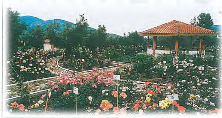
Γενική άποψη του Ροδόκηπου με ενδεικτικές καρτέλες για την ποικιλία και την προέλευση της κάθε τριανταφυλλιάς. Σύμβολο παλαιότερα της Αφροδίτης , του Ορφέα και των Μουσών , το ρόδο παραμένει πάντα πρώτο δοξαστικό της αγάπης και απέρρητη σημαία της ομορφιάς και της άνοιξης.