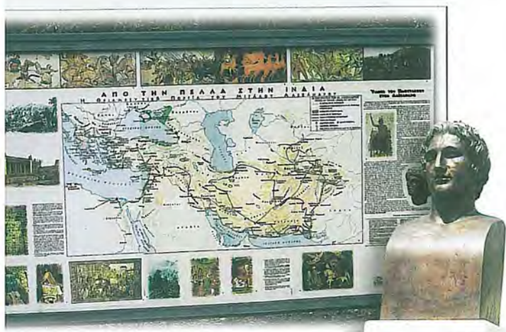
«Από την Πέλλα στην Ινδία». Μια όψη της θεματικής που αναφέρεται στην εκπληκτική εκστρατεία του Μεγάλου Αλεξάνδρου στη Μεγάλη Ανατολή. Στους πίνακες της θεματικής παρουσιάζονται, με παιδαγωγικό διδακτικό τρόπο και σπάνιο οπτικό υλικό, η εκστρατεία του Μεγάλου Αλεξάνδρου και η κοσμοϊστορική σημασία της, τα Ελληνιστικά Βασίλεια που δημιουργήθηκαν, οι μεγάλες Ελληνικές κοσμοπόλεις όπως η Αλεξάνδρεια και η Αντιόχεια και οι πολιτιστικές επιδράσεις στους λαούς της Ανατολής και σ' ολόκληρη την Οικουμένη. Δεξιά, η προτομή του Μεγάλου Αλεξάνδρου που φιλοτεχνήθηκε από τον γλύπτη Θεόδωρο Παπαγιάννη, Καθηγητή της Ανωτάτης Σχολής Καλών Τεχνών Αθηνών.