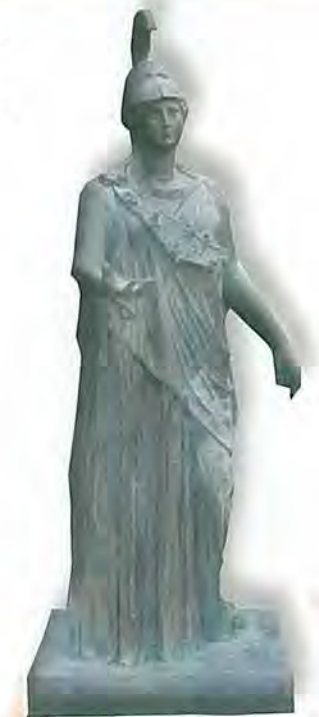
Η Θεά Αθηνά. Ορειχάλκινο άγαλμα της Θεάς Σοφίας και των Γραμμάτων και παισχου των Αθηνών. Αντίγραφο πρωτοτύπου τε κλασικών χρόνων, 4ος αι. π.Χ., που βρίσκεται στο Μουσείο Πειραιώς. Το αντίγραφο φιλοτεχνήθηκε από τον γλύπτη Γιώργο Ψυμμάνο.